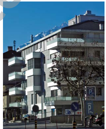
Photos: Le nouvel immeuble prend sa place naturelle de tête d'îlot en s'appuyant, sur sa face arrière, sur l'étape réalisée initialement.