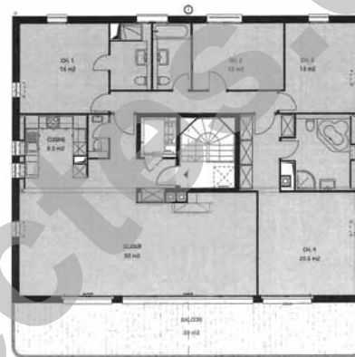
Plan des combles

La typologie va du 2 au 5 pièces répartie en deux appartements par étage, à l'exception des combles qui sont entièrement occupés par un unique appartement, particulièrement favorisé dans sa volumétrie grâce à une toiture voûtée. La pente du terrain a été exploitée pour dégager des garages privés semi-enterrés. Les logements bénéficient d'équipements très complets conformes au standing élevé du bâtiment. Les matériaux de finition étaient, bien sûr, au choix des acquéreurs. Les façades sont en béton propre, ce qui donne une allure contemporaine à l'immeuble. Le mariage avec les façades de verre des terrasses livre un contraste délicat qui dialogue harmonieusement avec les tonalités grises et bleues du lac Léman.