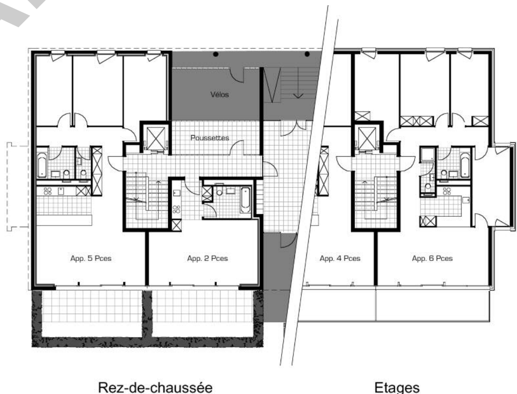
Plan type d'appartement au rez-de-chaussée et aux étages

L'architecture choisie, sobre et dépouillée, le mode de construction original et de grande qualité, le traitement systématique des espaces, ainsi que des options simples, compatibles avec les objectifs du programme, constituent la clé d'un projet novateur.