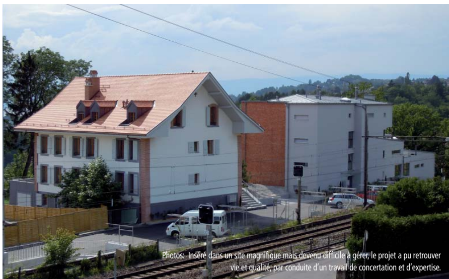
Photos: Inséré dans un site magnifique mais devenu difficile à gérer, le projet a pu retrouver vie et qualité, par conduite d'un travail de concertation et d'expertise.